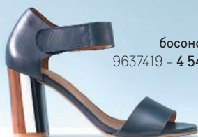
босоножки 9637419 – 4 549 р.