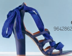
босоножки 9642862 – 4 549 р.