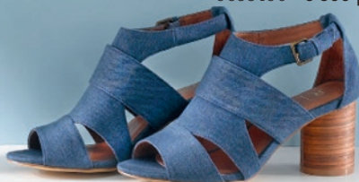
босоножки 9638490 – 3 899 р.