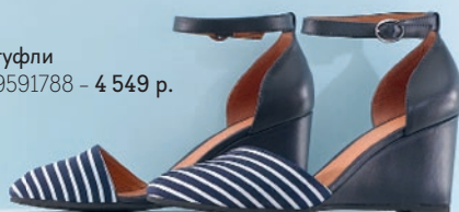
туфли 9591788 – 4 549 р.