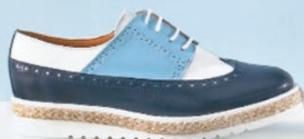
дерби 9627979 – 5 199 р.