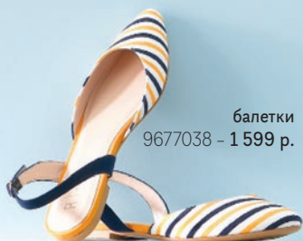
балетки 9677038 – 1 599 р.