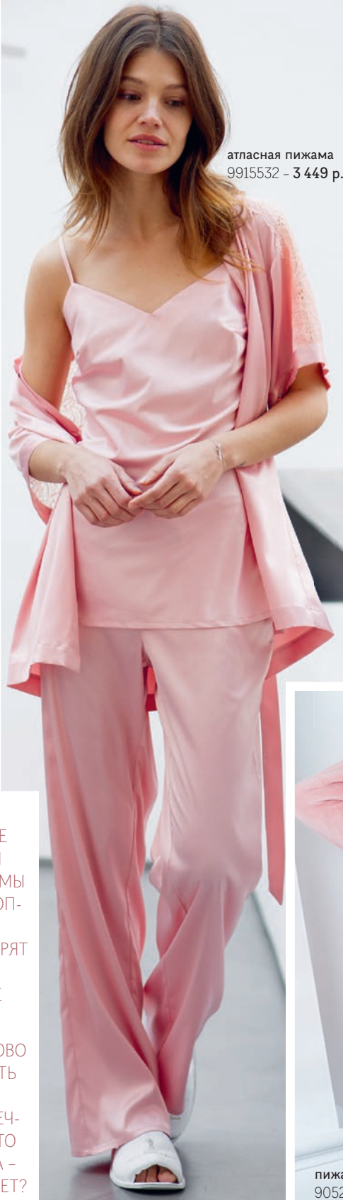
атласная пижама 9915532 – 3 449 р.

ПРОВЕДИТЕ ВРЕМЯ НАЕДИНЕ С СОБОЙ. НАШИ УЮТНЫЕ ПИЖАМЫ ИЗ МЯГКОЙ ХЛОП- КОВОЙ ВУАЛИ И АТЛАСА ПОДАРЯТ ВАШЕЙ КОЖЕ НЕЗАБЫВАЕМЫЕ МОМЕНТЫ.