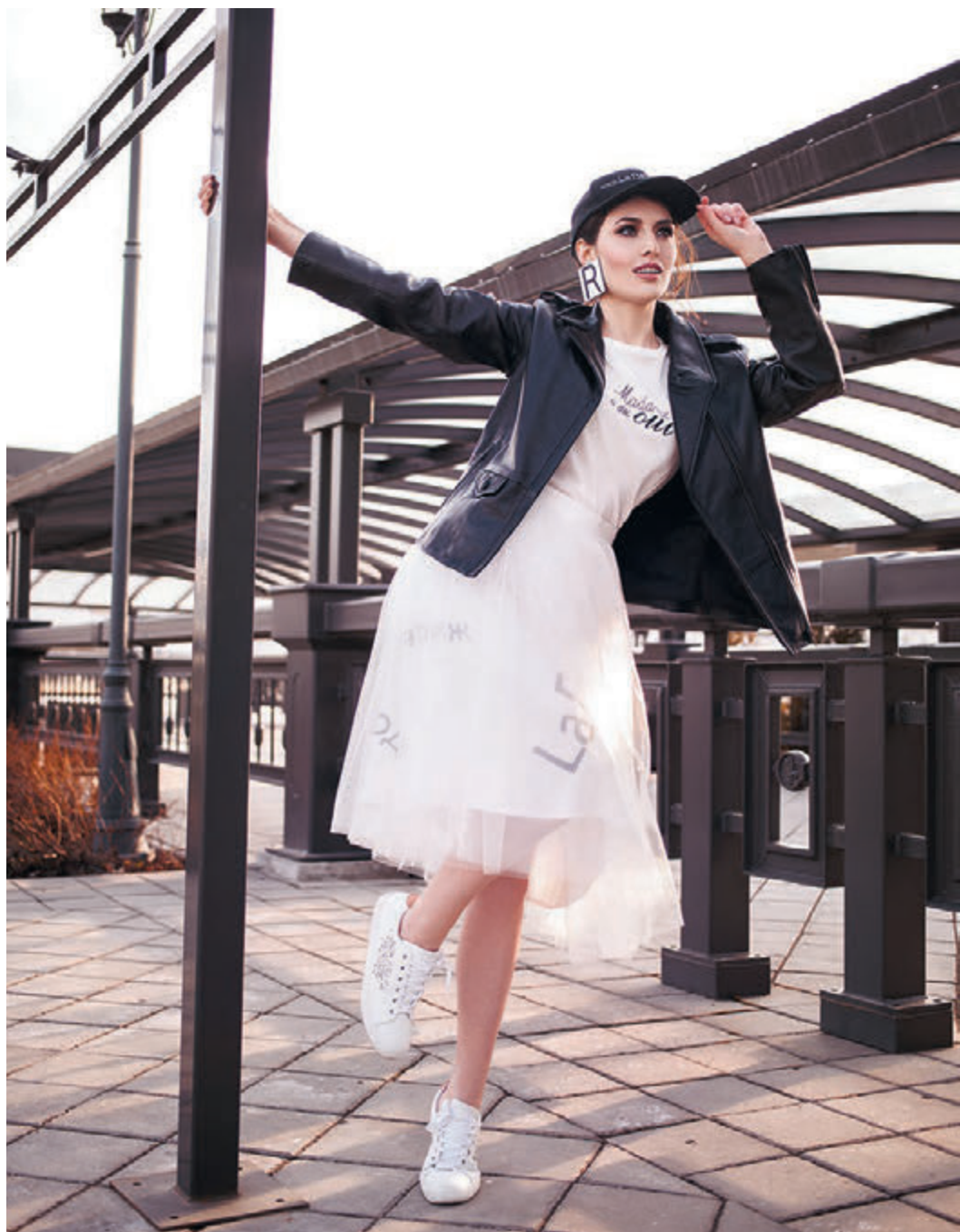
Куртка кожаная | 8893012 - 14 499 р. Футболка и юбка на laredoute.ru