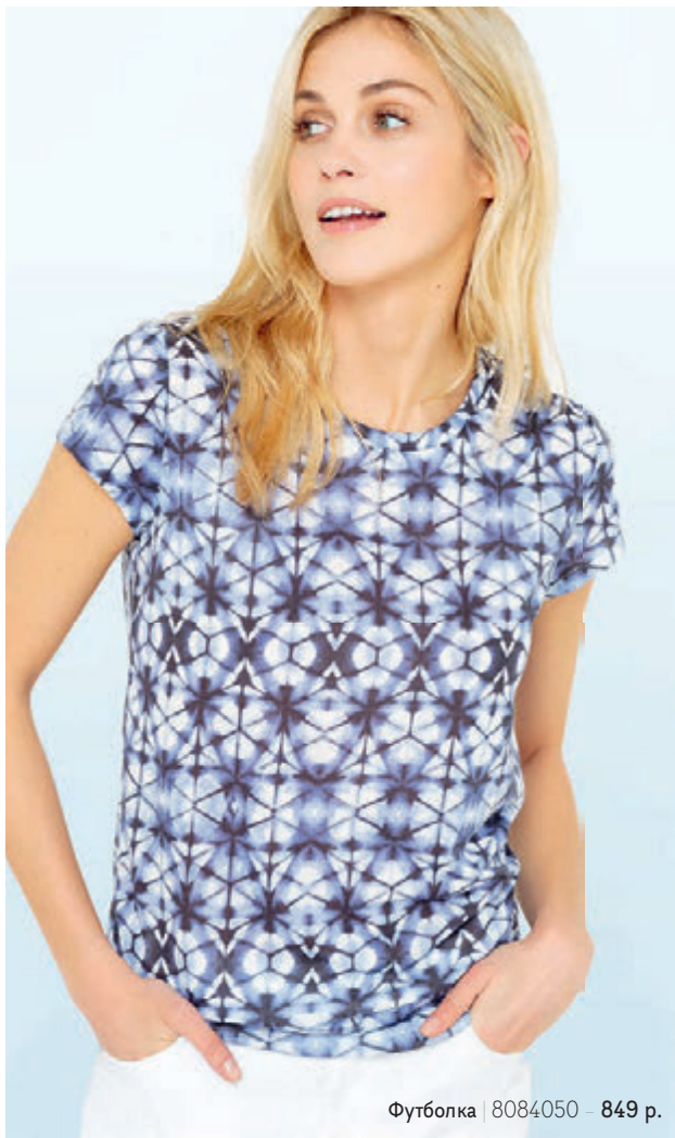
Футболка | 8084050 – 849 р.

СКИДКА 15% при заказе от 3 000 Р + БЕСПЛАТНАЯ ДОСТАВКА по коду 6377